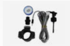
Kit detector de caudal