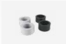
Kit reductores adhesivos