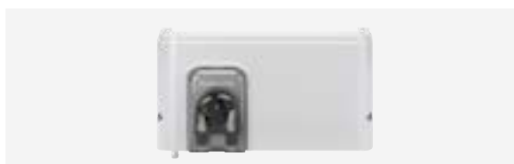
Módulo Dual Link (regulación del pH y Redox)