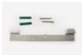
Kit montaje en pared