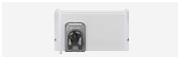
Módulo pH Link (regulación del pH)